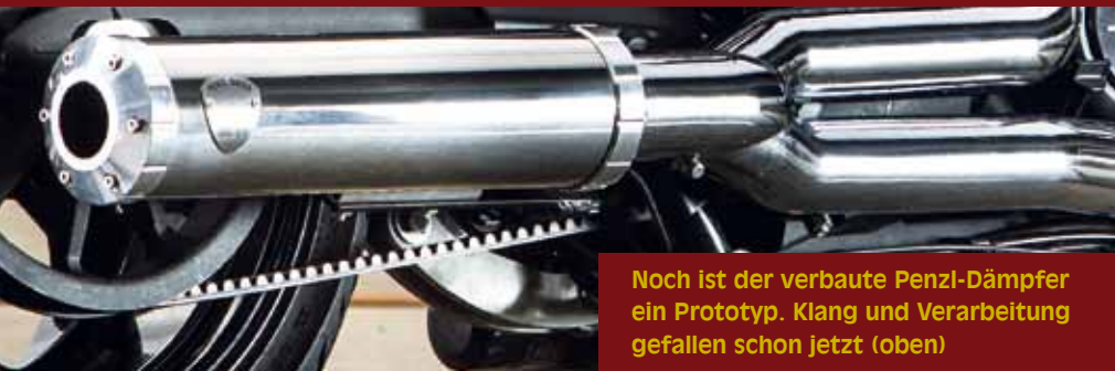
«Noch ist der verbaute Penzl-Dämpfer ein Prototyp. Klang und Verarbeitung gefallen schon jetzt (oben)»

Die technisch moderne und optisch klassisch-muskulöse Victory Hammer positioniert sich genau zwischen Harley-Davidson Dyna und V-Rod. Dort findet die 1,7 Liter-Maschine ihre eigene Nische. Und wer seine Hammer an die eigenen Wünsche anpassen will, für den gibt es mittlerweile auch Custom-Parts und Bike Builder mit Know How. Passt!