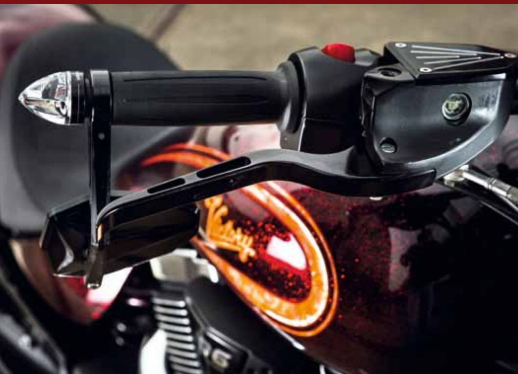
Perforierte Hebeleien und motogadget-Lenkerblinker verschönern den Arbeitsplatz (oben). Kein Handlungsbedarf: Das klassische, zentrale Rundinstrument der Serien-Hammer konnte auch für den Umbau beibehalten werden (rechts)