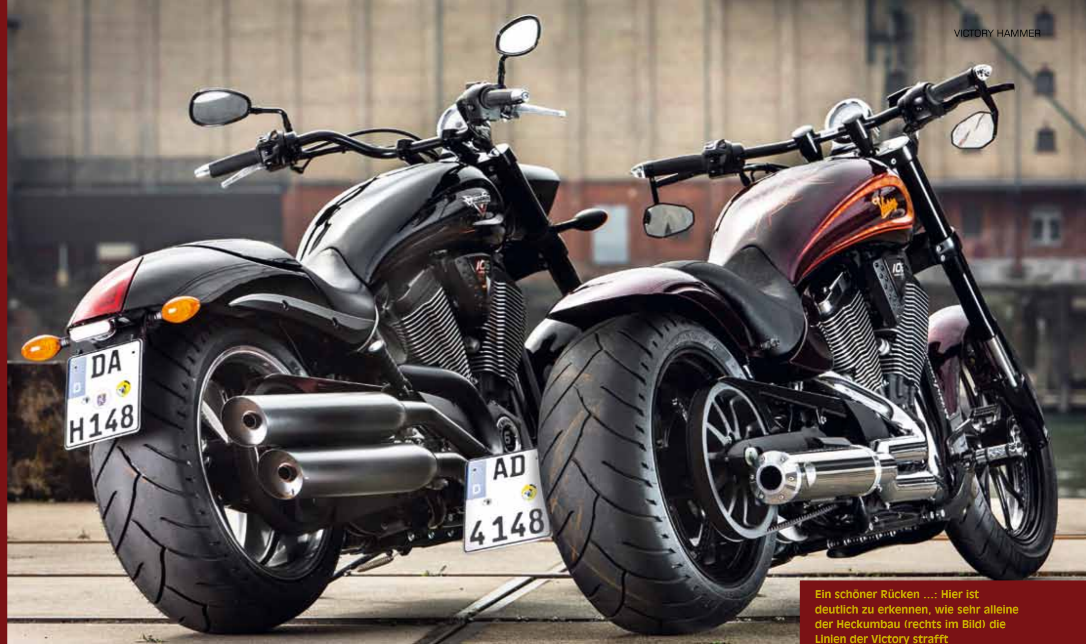
Ein schöner Rücken .... Hier ist deutlich zu erkennen, wie sehr alleine der Heckumbau (rechts im Bild) die Linien der Victory strafft